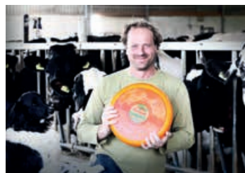
Kaas- en Zuivelboerderij Doruval