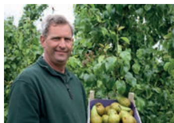
Groene Hart Fruit

H Groene Hart Fruit Presentatie bij Boer Hans Activiteiten Mastwijkkerdijk 7, 3417 BP, Montfoort, 0348-472548 Open voor Hoogvliet: vr 30/3 en za 31/3 10.00-17.00 uur